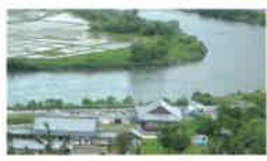
高麗館から望む最上川