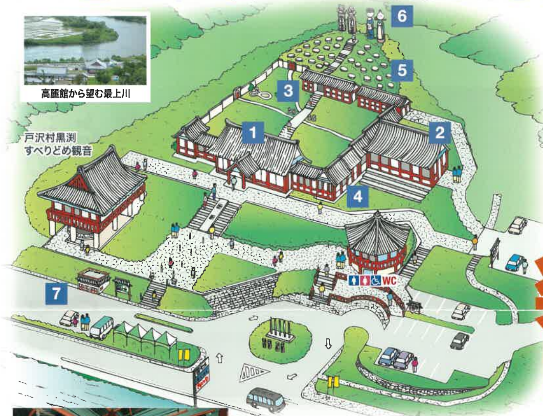
戸沢村黒淵 すべりどめ観音