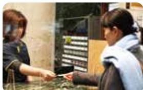
フロント (受付・ご案内・ご会計)

エコーホールでは館内施設のご利用受付やご案内、ご休憩、地元特産品の販売をしております。