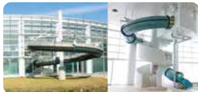
ウォーターライダー ※身長120cm以上