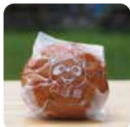
ほんぼまんじゅう